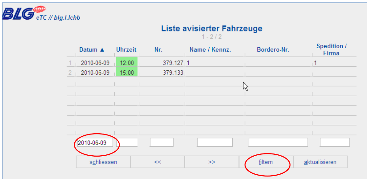
Abbildung 2: Beispiel für filtern und sortieren

Über die Funktion <filtern> hat man die Möglichkeit eine Listanzeige nach bestimmten Kriterien anzeigen zu lassen. In diesem Beispiel werden alle Zeilen gefiltert, die in dem Feld „Datum“ den Wert „2010-06-09“ enthalten.