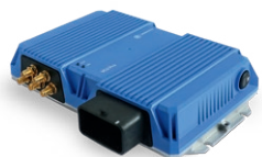
VCU Pro Onboard Unit Telematik-Gateway

Mit unseren innovativen Lösungen, Monitoring-Systemen und digitalen Services unterstützen wir Bahn-Betreiber in der permanenten Überwachung, der frühzeitigen Wartungsplanung und prädiktiven Instandhaltung ihrer Flotten. So können Effizienz, Zuverlässigkeit und Sicherheit im Schienenverkehr durch den Einsatz integrierter Sensoren und fortschrittlicher Datenanalysetools weiter gesteigert werden.