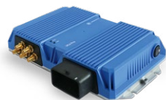
VCU Pro Onboard Unit Telematik-Gateway

Mit unseren innovativen Lösungen, Monitoring-Systemen und digitalen Services unterstützen wir Bahn-Betreiber in der permanenten Überwachung, der frühzeitigen Wartungsplanung und prädiktiven Instandhaltung ihrer Flotten. So können Effizienz, Zuverlässigkeit und Sicherheit im Schienenverkehr durch den Einsatz integrierter Sensoren und fortschrittlicher Datenanalysetools weiter gesteigert werden.