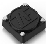
Heavy Duty TAG Kabelloser Sensor