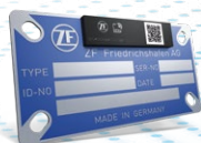
Smart Typeplate Digitales Typenschild