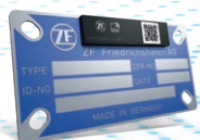
Smart Typeplate Digitales Typenschild