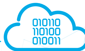
ZF IoT Cloud

为了根据客户需求定制数字平台, 采埃孚系统性、战略性地扩大与制造商、运输部门和其他技术公司的合作伙伴关系, 以实现安全可靠的铁路交通。