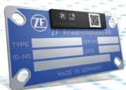
蓝牙传感器 数字铭牌