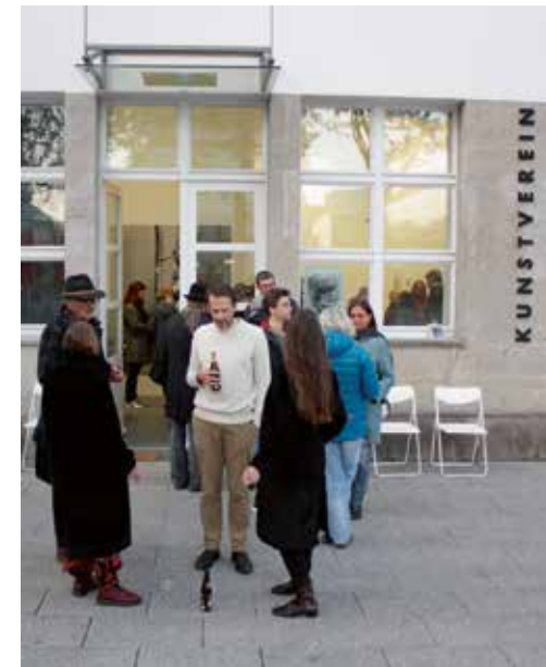
Festtag: Der Kunstverein eröffnet zum Kunst-Freitag seine diesjährige Mitgliederausstellung.