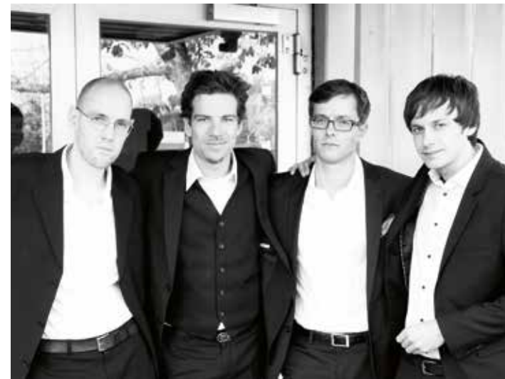
The Real Mob