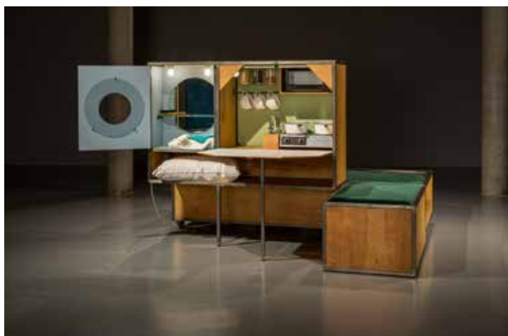
Ausstellungsansicht IDEAL STANDARD. Spekulationen über ein Bauhaus heute