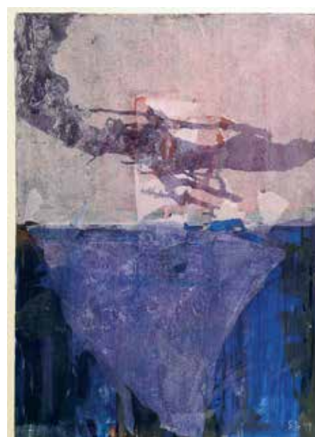
Dietlinde Stengelin, »Gebrochenes Weiß«, 1994