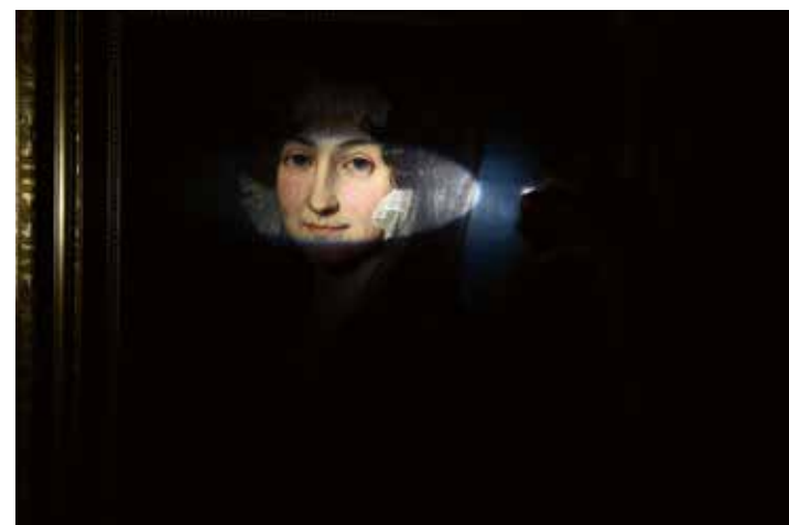
Franz Xaver Winterhalter, »Damenporträt«, 1827