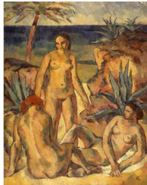
Karl Caspar, »Frauen am Meer«, 1914