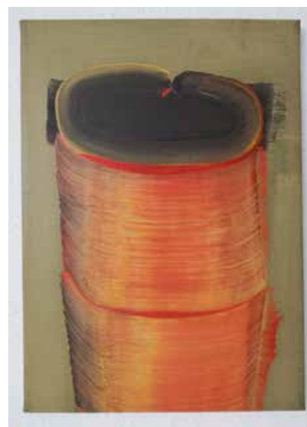
Hyun-Sook Song, »4 Pinselstriche«, 2000