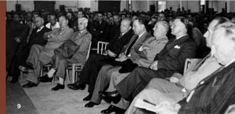
ZF gründete den Europäischen Betriebsrat im Jahr 2000 10