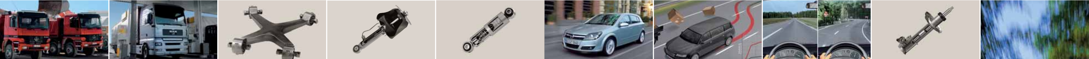
Mercedes-Benz Actros MAN TG-A Vierpunktklenker Luftfeder-Dämpfermodul Nutzfahrzeugdämpfer Opel Astra mit CDC-Dämpfungssystem CDC erhöht die Fahr-sicherheit bei Ausweich-manövern CDC sorgt für mehr Sicherheit und Fahr-dynamik Elektronisch ge-steuertes variables Dämpfungssystem