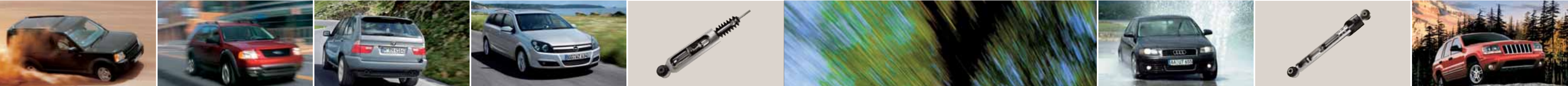
Land Rover Discovery